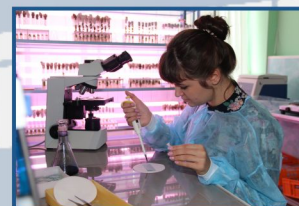
Студенческий клуб - лауреат международных конкурсов