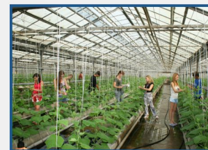
Инжиниринговый центр «Агротехника»